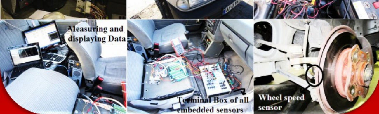
Terminal Box of all embedded sensors